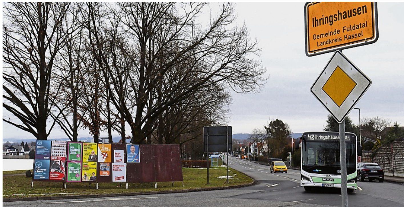
Buntes Gemenge an Wahlwerbung: Am Ortseingang von Ihringshausen haben alle Parteien plakatiert, die auch ins Gemeindepalament möchten – inklusive der AfD, die jedoch nicht antritt.

Mit 37 Namen auf der Liste ist die CDU die Partei mit den meisten Parlamentsanwärtern. Auch sie strebt danach, stärkste Kraft in der Gemeindevertretung zu werden. CDU-Spitzenkandidat